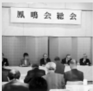
東京鳳鳴会 6・8 ホテルグランドパレス