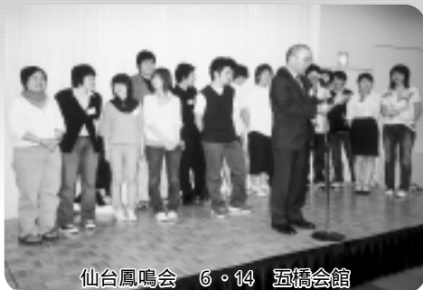
仙台鳳鳴会 6・14 五橋会館